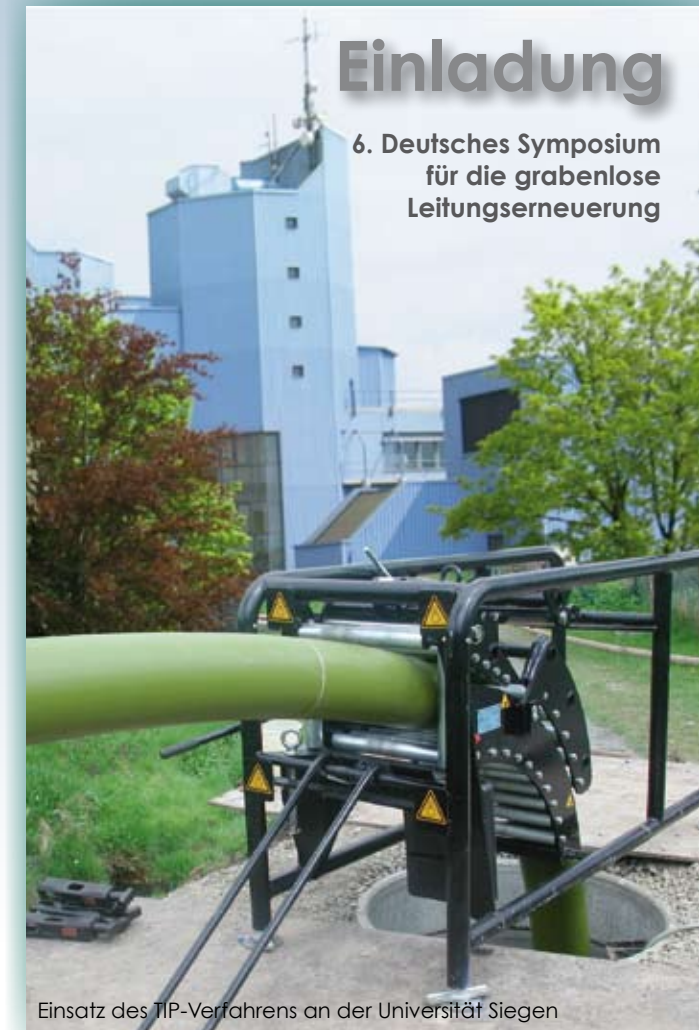
Einsatz des TIP-Verfahrens an der Universität Siegen